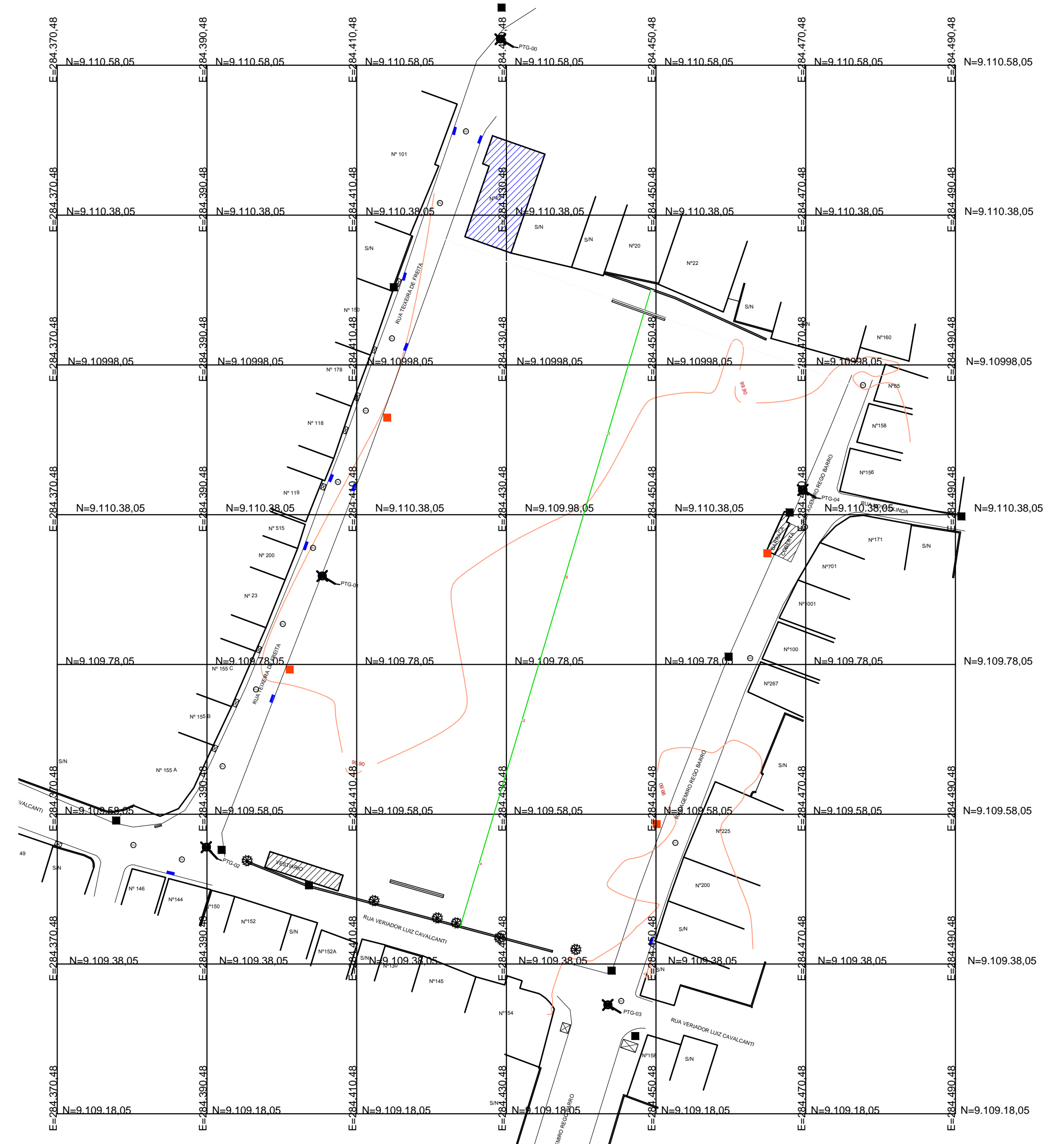
PLANTA BAIXA - COORDENADAS ESCALA 1/500