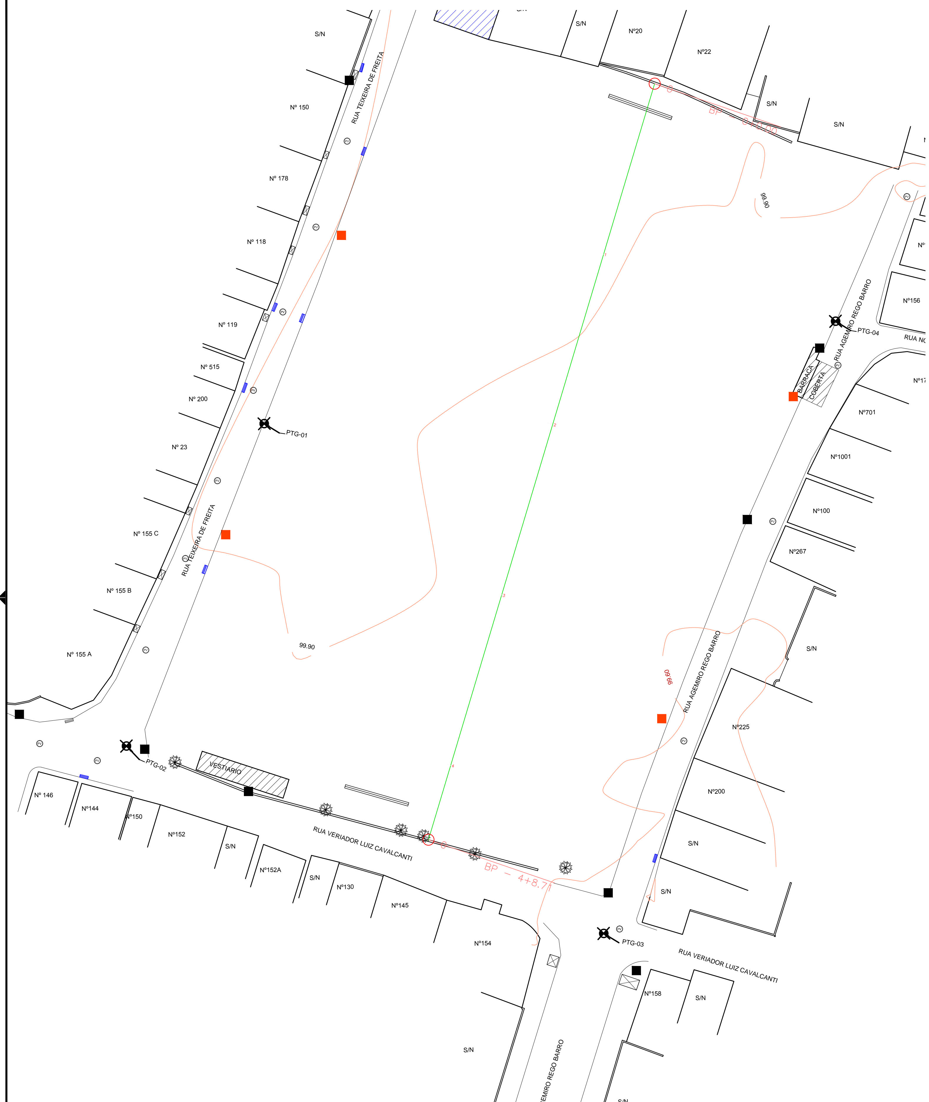
LEVANTAMENTO PLANIMÉTRICO ESCALA 1/250